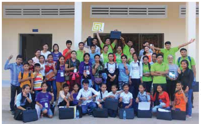
Les participants de l'atelier

Au total, ces deux journées, pleines de travaux participatifs, ont favorisé l'appropriation par tous, des conditions de succès et de pérennisation des clubs de jeunes, ont permis aussi de mieux optimiser et valoriser les activités des « Biblio-Sac à dos ». A cette occasion a été réaffirmée la feuille de route : que chaque Club ait au moins deux « Sacs à dos » en activité avec 30 livres minimum dans chacun pour aller proposer des activités de lecture aux familles les plus fragilisées vivant loin des sources éducatives, chaque site sera visité 4 fois par mois avec un objectif de 50 lecteurs minimum. Enfin, les sessions de soutien scolaire ont été détaillées avec des témoignages de « petits profs » permettant à chaque Club de se recaler sur l'objectif de 3 classes au minimum par Club, tenues par « 6 petits profs » réunissant entre 15 et 25 enfants. Des jeux en khmer favorisant les apprentissages en langue et en mathématiques ont été présentés. Chaque leader s'est engagé à détailler son plan d'action dès son retour dans sa communauté. Il bénéficiera du soutien de Samet et des jeunes volontaires de Youth Star. ■