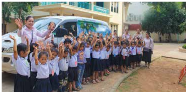
Bibliobus en maternelle

Le bibliobus consacré au sujet de l'environnement a pris la route au mois de novembre, direction Siem Reap pour des sessions dans deux villages et une maternelle. L'enjeu : la sensibilisation au sujet des sacs plastiques des villages de Somrong, Norkor Krao et Angkor. Le bibliobus a également participé à la Journée Familles de Cambodia Airport à Siem Reap qui a réuni plus de 500 parents et enfants.