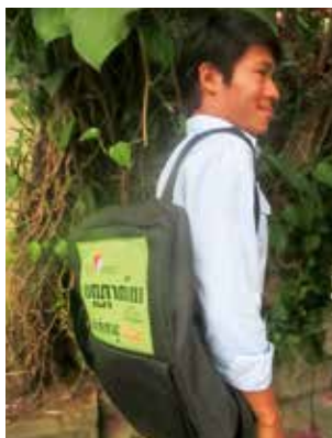
Jeune avec un Biblio-Sac à dos