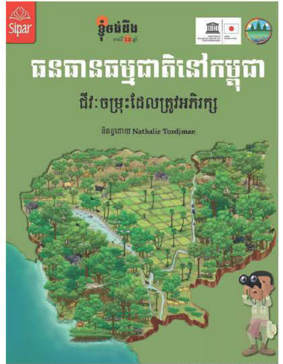
La biodiversité au Cambodge