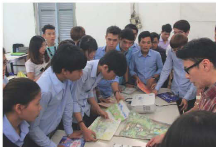
Université Royale des Beaux-arts