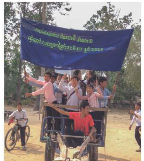
Journée Nationale de la lecture dans un club de jeunes