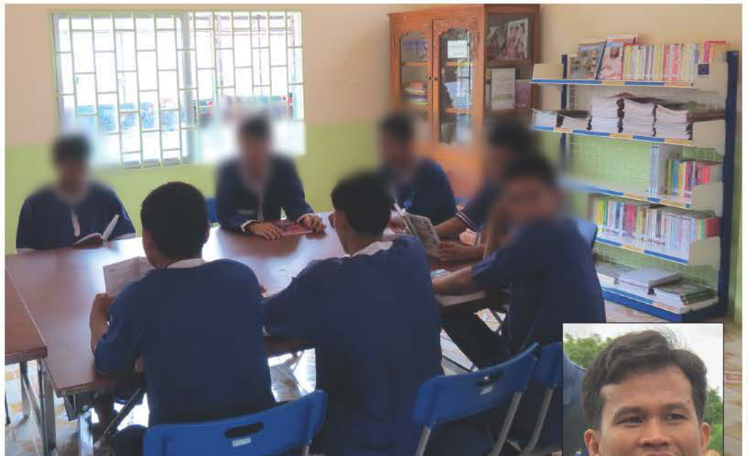
Une bibliothèque de prison