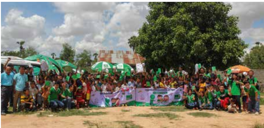
Salariés SMART, l'équipe Sipar et les enfants

Le 23 juillet, des salariés et certains clients de Smart sont venus participer à la session d'un bibliobus dans le village de Tboung Domrei, proche de Takéo. Ils ont participé à la narration d'histoires menée par le bibliothécaire devant près de 200 enfants et villageois. Ils ont également assisté et animé des activités récréatives et éducatives pour la plus grande joie des enfants.