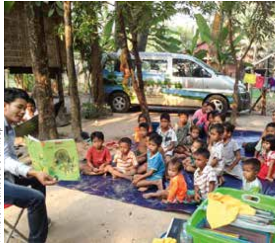
Animation bibliobus à Siem Reap

Depuis maintenant plus de 15 ans, les bibliobus Sipar parcourent les routes des campagnes et des banlieues, apportant dans des pagodes, des cours d'école ou tout autre endroit de vie communautaire, livres, éducation et lutte contre l'illettrisme. Depuis 3 ans, la moitié d'entre eux s'est « spécialisée » avec des sessions dédiées à des thématiques sociétales clefs pour le Cambodge : sécurité routière, environnement et dès ce mois-ci, nutrition et santé. A l'heure du « tout très vite » et du digital, on pourrait croire que l'outil bibliobus a fait son temps. Il n'en est rien et nous avons toujours besoin de nos fidèles soutiens pour les financer et poursuivre cette action fondamentale. Qu'en disent face à face animateur et bénéficiaire ?