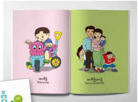
Mon premier imagier

A la suite de ce premier titre, quatre autres « Premiers imagiers » vont être publiés : Ma vie quotidienne - Mes fruits préférés - Mes légumes préférés - Mes jouets préférés. Ces cinq titres seront diffusés et utilisés par nos bibliothécaires mobiles et les membres des Clubs de Jeunes dans les villages et les écoles maternelles mais seront également mis en vente dans des emballages-cadeau pour promouvoir les livres en tant que cadeaux lors de naissance ou d'anniversaire d'enfant dans les familles cambodgiennes. ■