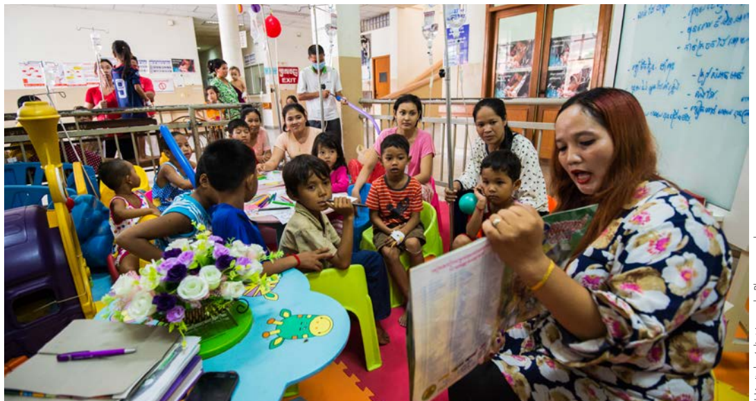
Hôpital pédiatrique de Phnom Penh