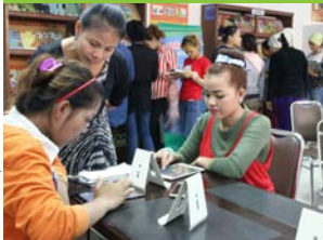
Bibliothèque de l'usine TY Fashion

Grâce à Smart Axiata, les 18 Bibliothèques Centres de Ressources des usines textiles vont être progressivement équipées de 36 tablettes ; cette opération de mécénat s'est déroulée simultanément à l'ouverture de la nouvelle bibliothèque de l'usine TY Fashion. Rappelons que le projet usine n'a pu voir le jour que grâce au tour de table constitué de nos principaux partenaires : Weave our Future (Auchan Retail), l'AFD et nos deux associations partenaires, Care et CWPDP.