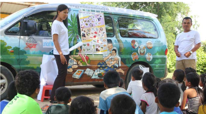
Animation bibliobus nutrition

de la nutrition, de l'hygiène, de la qualité de l'eau et de façon globale de la santé. Les activités principales iront du rappel de l'importance de bien se laver les mains à l'équilibre alimentaire, en passant par une information pratique sur les services des centres de santé. Avec l'appui des chefs de village et des conseils communaux, cette nouvelle « bibliothèque sur roues » visitera hebdomadairement 6 villages des environs de Phnom Penh, et des provinces de Kratie, et du Ratanakiri. Il touchera également 90 autres villages à intervalle moins régulier. Au total l'objectif est d'atteindre plus de 4 500 enfants et adultes avec des livres et un matériel pédagogique développé spécifiquement. L'activité classique de lecture et d'emprunt de livres accompagnera partout cet objectif de sensibilisation supportée par des vidéos éducatives, des chansons et jeux, des distributions de matériel pédagogique engageant à poursuivre la discussion au sein de la cellule familiale. ■