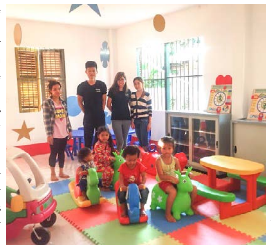
Hôpital Sre Krasaing de Stoueung Treng

Les bénéficiaires de ces deux derniers coins lecture sont spécifiques. Le centre de santé de Sre Krasaing attire en effet non seulement des enfants venant pour leurs consultations mais également des enfants des écoles primaires et secondaires se trouvant dans les environs du centre.