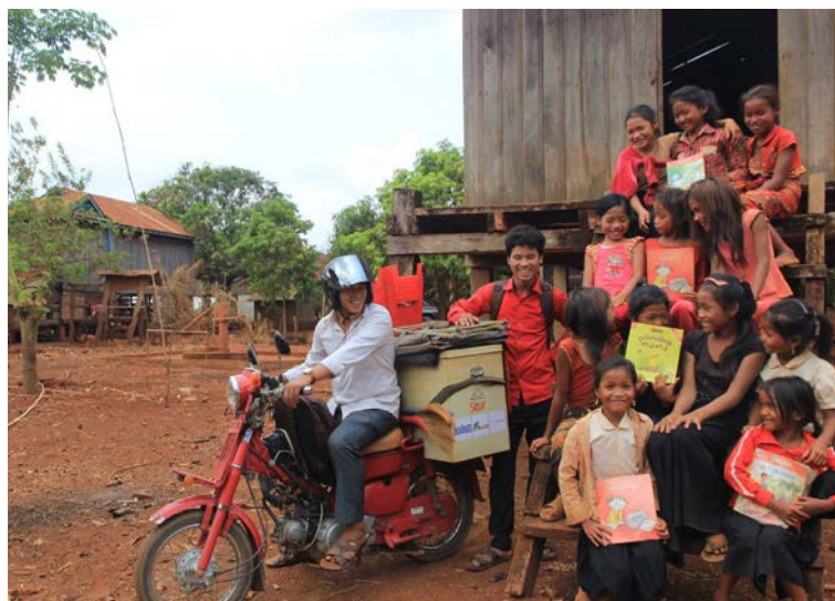
Bibliomoto dans la province de Ratanakiri