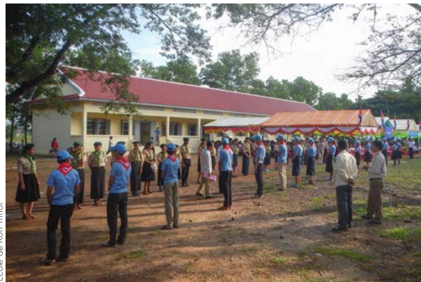
Ecole de Koh Timot