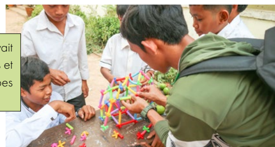
Expérience de construction

Pour s'initier à la construction, chaque groupe devait construire une tour en assemblant des petits tubes et le gagnant était celui qui avait utilisé tous les tubes avec la conception la plus créative.