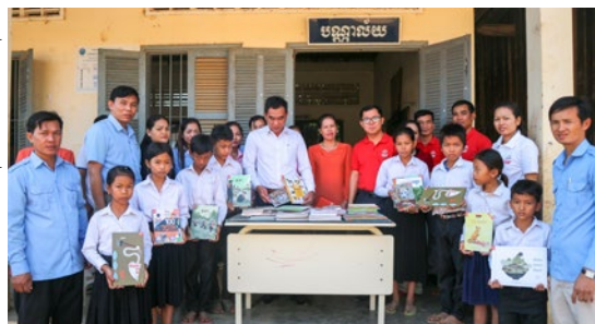
Distribution des livres pour la bibliothèque

Le Ministère de l'Éducation a reconnu la pertinence des bibliothèques (les taux d'abandon scolaire et de redoublement diminuent dans les écoles dotées d'une bibliothèque) et il a mis en place une véritable politique nationale, ainsi qu'un service dédié aux bibliothèques scolaires au sein du ministère, avec l'appui de SIPAR.