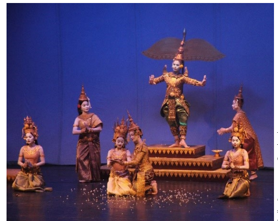
Ballet Royale au Cambodge

L'ouverture au public de ce spectacle a été une belle opportunité pour plus de 1500 habitants de Phnom Penh de découvrir cette danse traditionnelle. Sipar a été invité par la famille Royale à présenter son livre sur la danse classique khmère en début de spectacle.