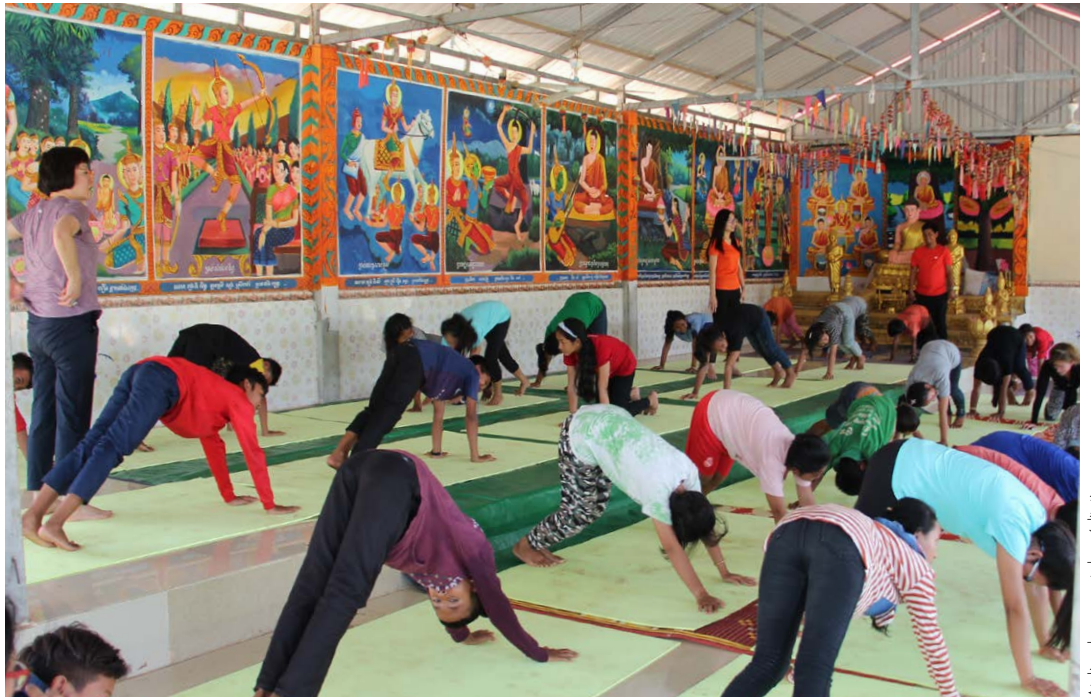
Atelier de yoga et de méditation