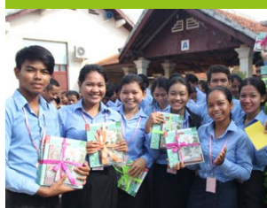
Donation de livres EPP

Afin que le livre devienne un véritable outil pédagogique pour les instituteurs, Sipar travaille depuis 2005 avec les EPP, les centres de formation des futurs instituteurs. Après avoir créé le curriculum et formé les élèves-maîtres sur les « bibliothèques et livres pour enfants » entre 2005 et 2010, Sipar offre les livres aux futurs instituteurs.