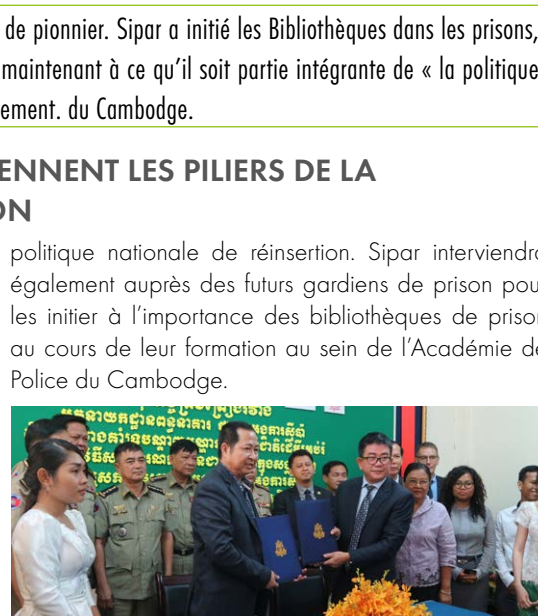
Signature le 12 juin phase 3 du programme

L'accès à l'instruction et à la formation en milieu carcéral reste un véritable enjeu pour le Cambodge. Les défis sont nombreux : le faible niveau éducatif du personnel des établissements pénitentiaires, les difficultés d'accès à l'électricité, la surpopulation carcérale, etc. Sipar a monté une plateforme d'échanges avec 10 acteurs clés travaillant sur les conditions de détention en prison au Cambodge, dont ICRC, MS, MT, Licado, OHCHR, Caritas Cambodia, Prison Fellowship of Cambodia, pour parler d'une voix unie face aux autorités nationales et préparer un avenir éducatif pérenne dans l'ensemble du milieu carcéral.