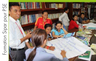
Formation Sipar pour PSE

Depuis mars 2019, Sipar est aux côtés de l'ONG Pour un Sourire d'Enfant (PSE) pour la formation de ses bibliothécaires à la base de la gestion documentaire et à l'animation d'activités autour de la lecture – jeux éducatifs, création et narration d'histoires – pour les enfants et adolescents des établissements scolaires et des centres de rattrapage scolaire gérés par PSE. Rappelons que PSE œuvre depuis 20 ans auprès de l'enfance défavorisée au Cambodge. D'avril à juin, 2 formations et 3 sessions de suivi et de soutien technique ont été effectuées auprès de 15 bibliothécaires PSE. Ces formations apportées par Sipar illustrent les liens très anciens entre les deux associations puisque PSE Cambodge a été créée par Christian et Marie-France Despalières à la suite de leur intervention à Phnom Penh pour Sipar.